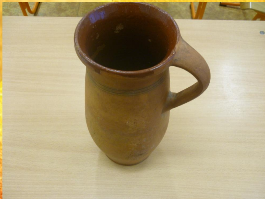
Krčah na mlieko