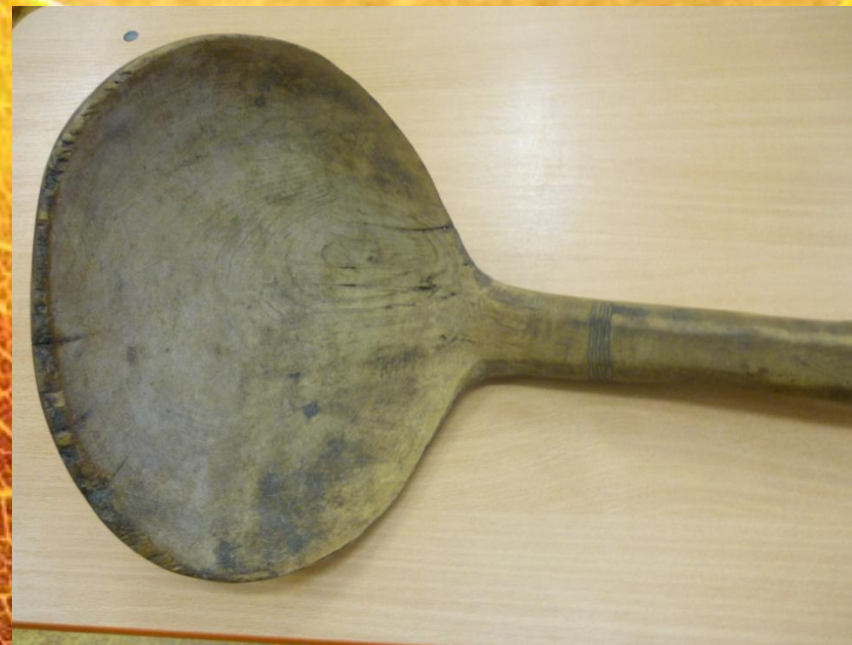
Varecha na vyberanie syra