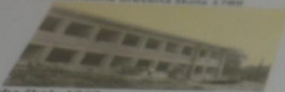
Stavba školy 1960