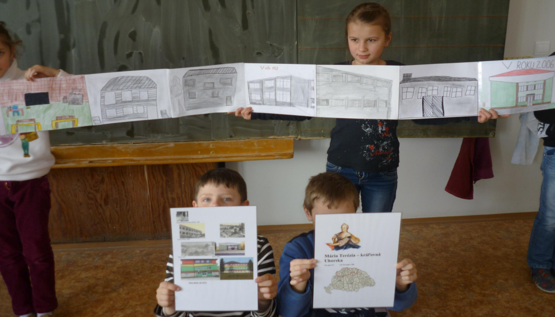
Moderné vzdelávanie pre vedomostnú spoločnosť/Projekt je spolufinancovaný zo zdrojov EÚ.