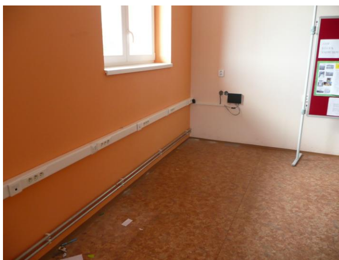
Šiesta trieda pred zariadením

Štvrtá trieda sa postupne menila. Spravili sa elektrické rozvody, pripojenie na internet, zásuvky pre napojenie počítačov a tlačiarne. Vynieslo a zapojilo sa laboratórium na výuku cudzích jazykov. Zakúpili sa stoly, ktoré sa umiestnili jednak do menovanej učebne a jednak do šiestej triedy.